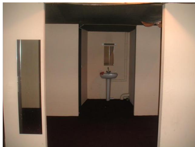
Une des loges équipées du Grand Écran Italie (Espace détente, lavabo, douche, wc)