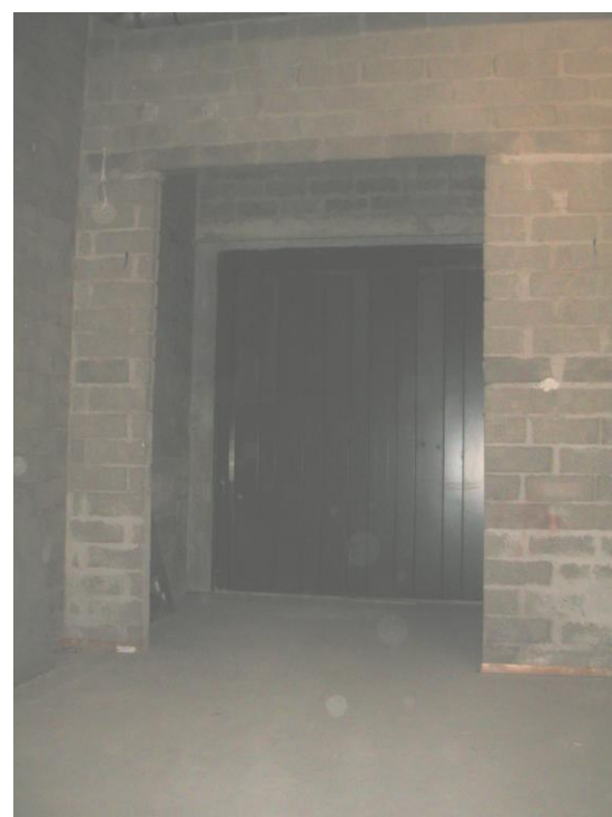
Entrée du monte-charge relié au sous-sol du parking Italie 2