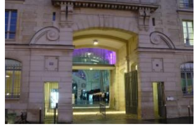
Le 104, rue d'Aubervilliers, à Paris.