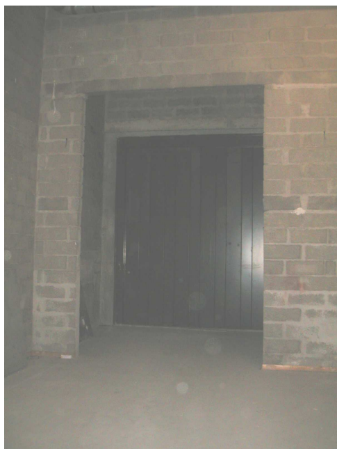
Entrée du monte-charge relié au sous-sol du parking Italie 2