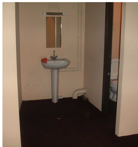
Une des loges équipées du Grand Écran Italie (Espace détente, lavabo, douche, wc)